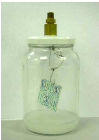
FIGURA 1. Foto ilustrativa de um sache na célula de adsorção, com solução salina para geração da umidade relativa desejada.

Foram utilizadas células de adsorção de oxigênio, compostas por frasco de vidro de capacidade volumétrica nominal de 600mL e 1000mL, com tampa metálica, à qual foi acoplado um sistema de coleta hermética de gás do espaço livre do frasco, através de um septo de borracha vedante.