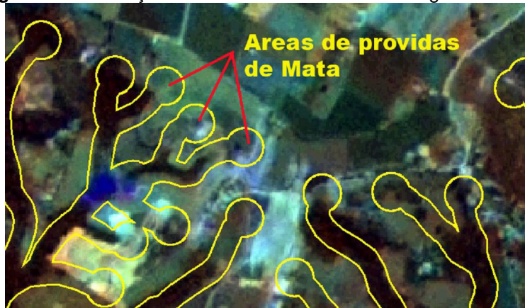
Figura 2: Detalhe da imagem de satélite com limites das APP, mostrando áreas de APP deprovidas de vegetação natural