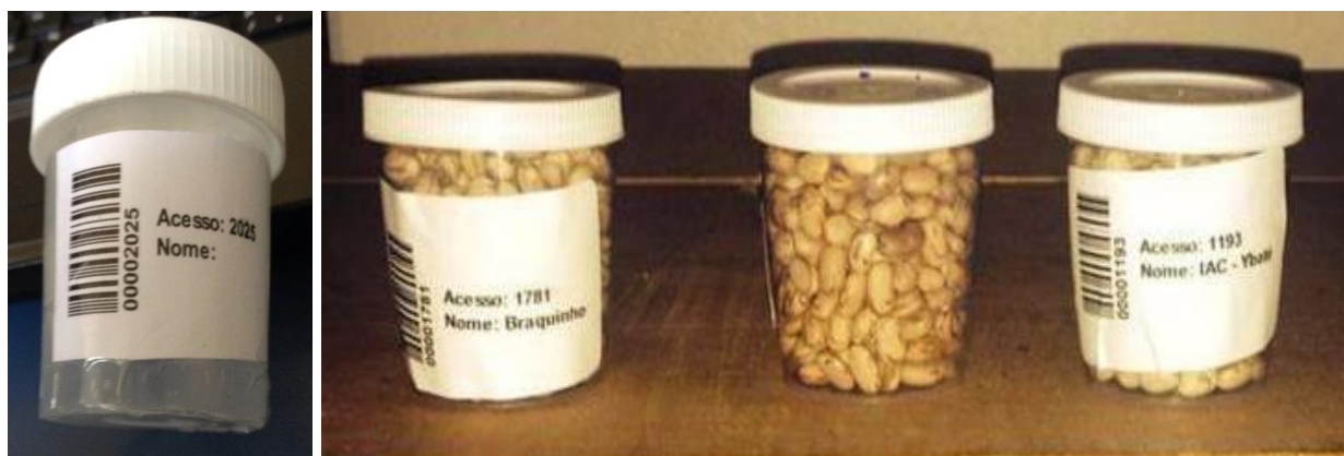
Figura 4. Acessos do BAG-Feijão identificados com etiquetas de código de barras.

A geração do código de barras facilitou a identificação e o manejo dos acessos do BAG-Feijão dentro e fora da câmara fria (Figura 4). Por meio de um leitor de código de barras, acoplado a um computador ou tablete, os acessos são facilmente identificados nas prateleiras diminuindo o tempo de trabalho em ambiente frio. Essa ação poderá, também, ser realizada por meio de smartfone com acesso a internet.